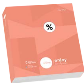
I Enjoy-boken du har fått utdelt

Fullstendig oversikt over alle aktørene finner du flere steder: